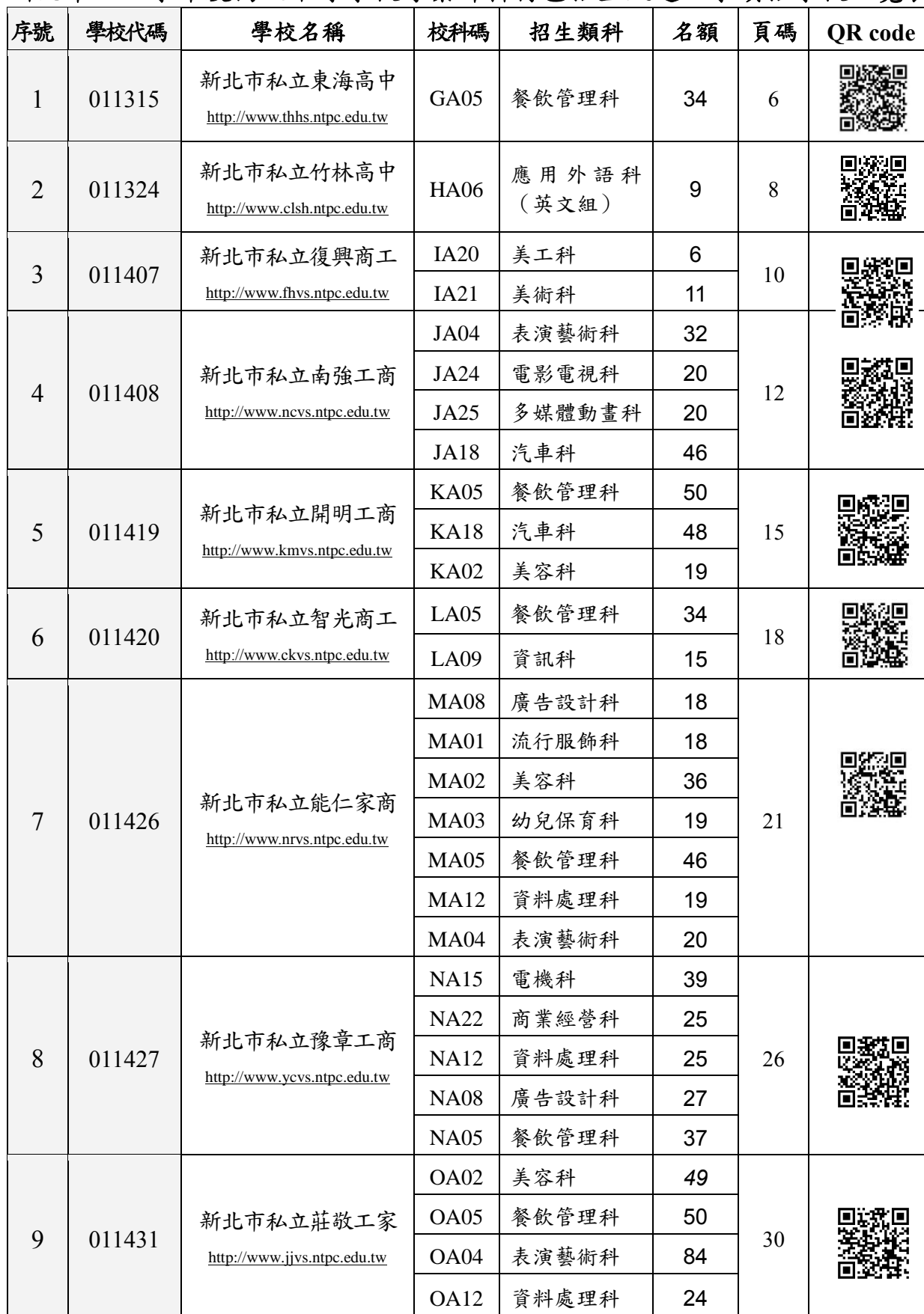
新北市 106 學年度高級中等學校專業群科特色招生甄選入學續招學校一覽表