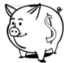
私校退撫儲金(新制)-自主投資 107年度1~12月期間報酬率

3.資料來源:財團法人中華民國私立學校教職員退休撫卹離職資遣儲金管理委員會網站公告資料。