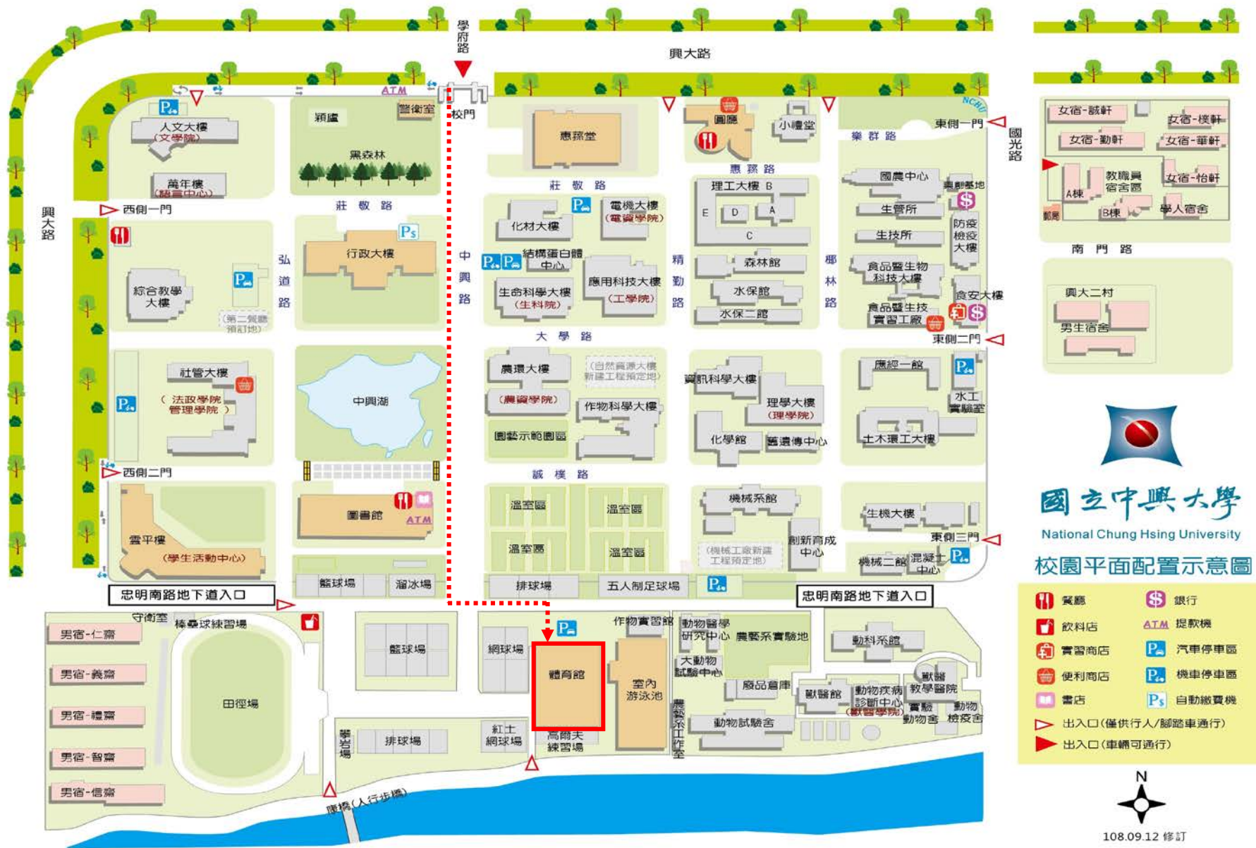
國立中興大學體育館位置圖